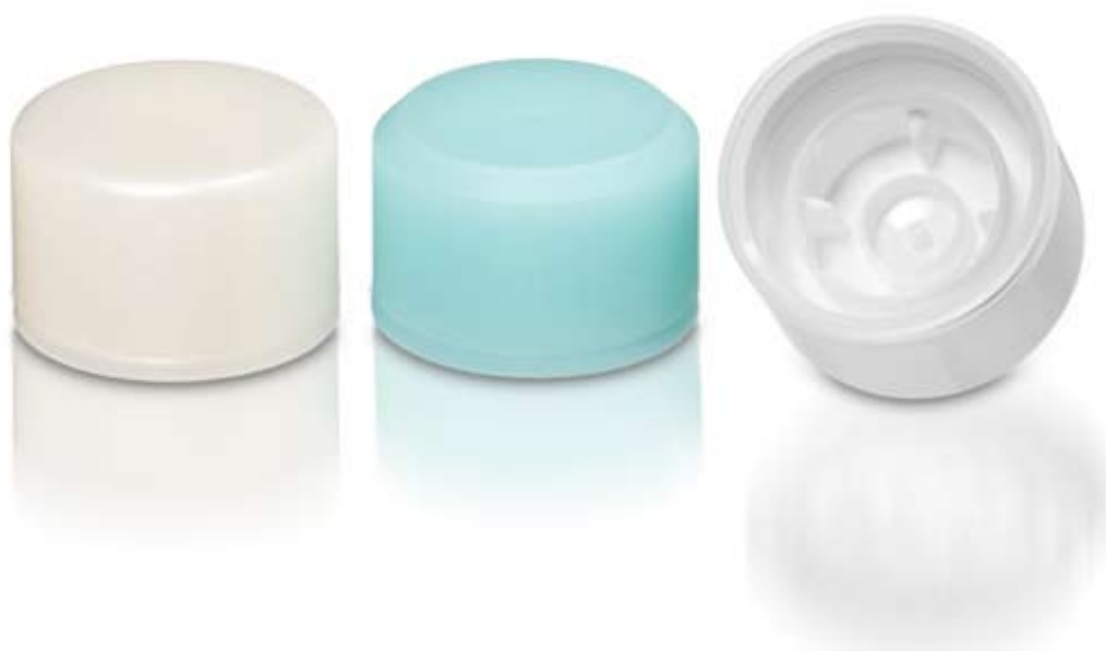
APT32C Versión mate